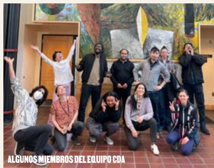
ALGUNOS MIEMBROS DEL EQUIPO CDA