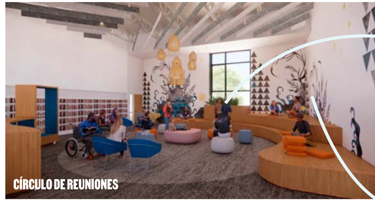
CÍRCULO DE REUNIONES

Salas comunitarias flexibles para eventos que pueden abrirse a la plaza exterior.