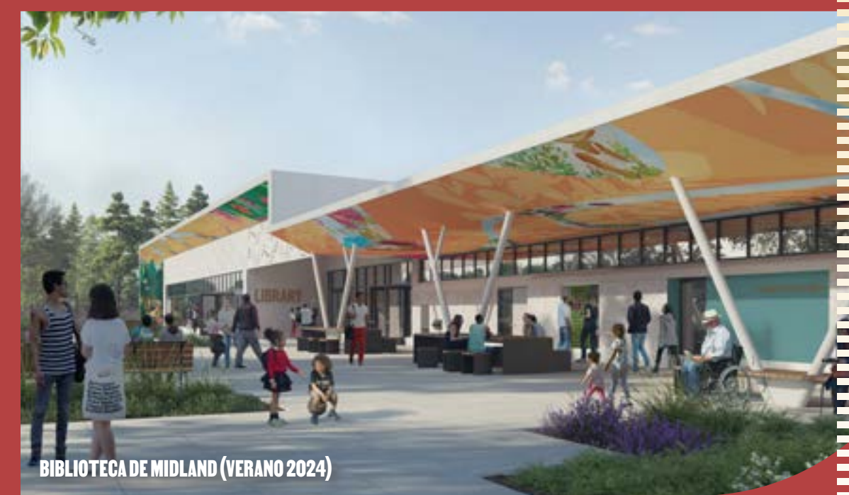
BIBLIOTECA DE MIDLAND (VERANO 2024)