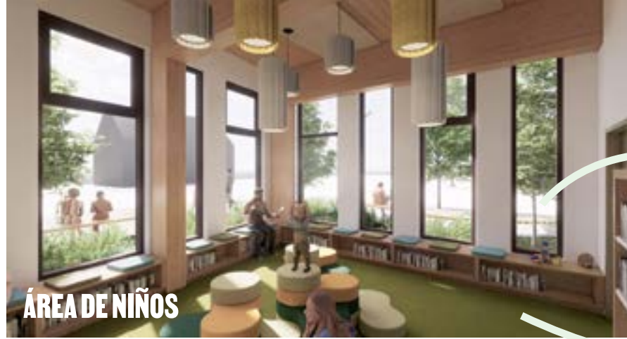
ÁREA DE NIÑOS

Luz natural adecuada en todo el edificio para estar conectado con las estaciones.