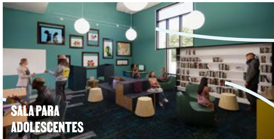
SALA PARA ADOLESCENTES

Amplio espacio de juego y aprendizaje para niños y familias.