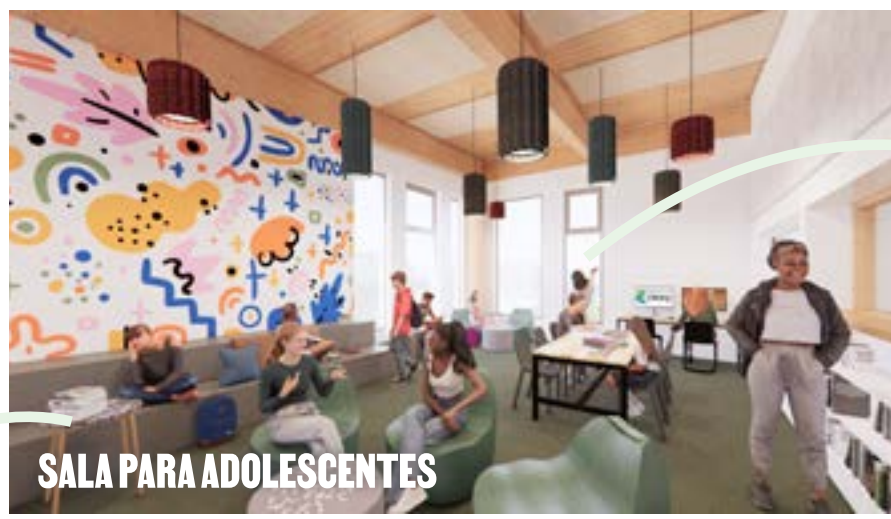
SALA PARA ADOLESCENTES

Mayor acceso a computadoras y tecnología.