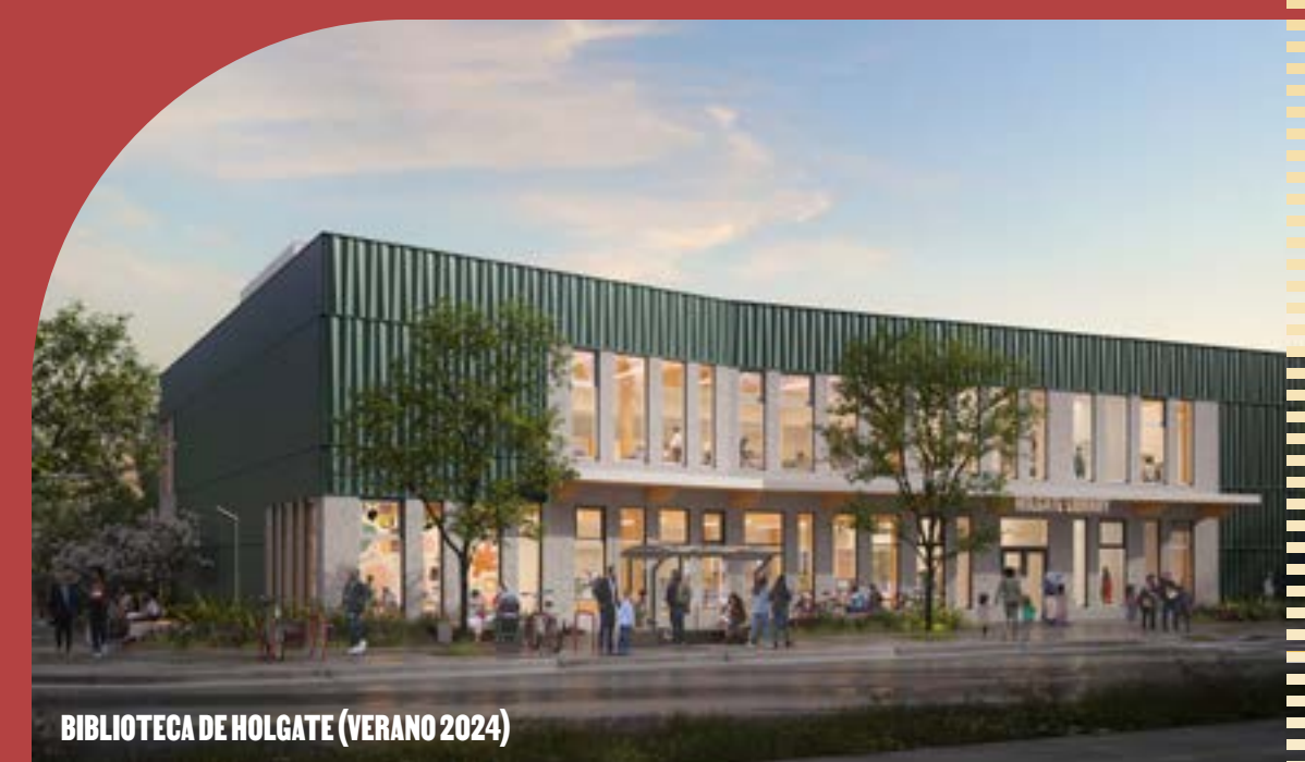
BIBLIOTECA DE HOLGATE (VERANO 2024)